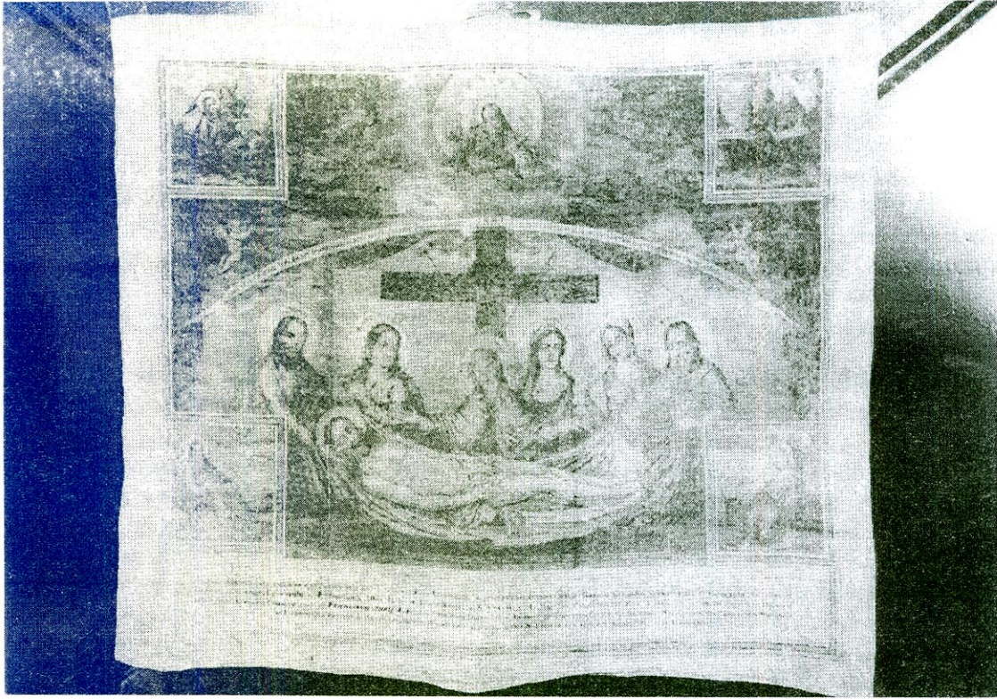
Fig. 1 Antimisul mitropolitului Alexandru Sterca Șuluțiu, 1857