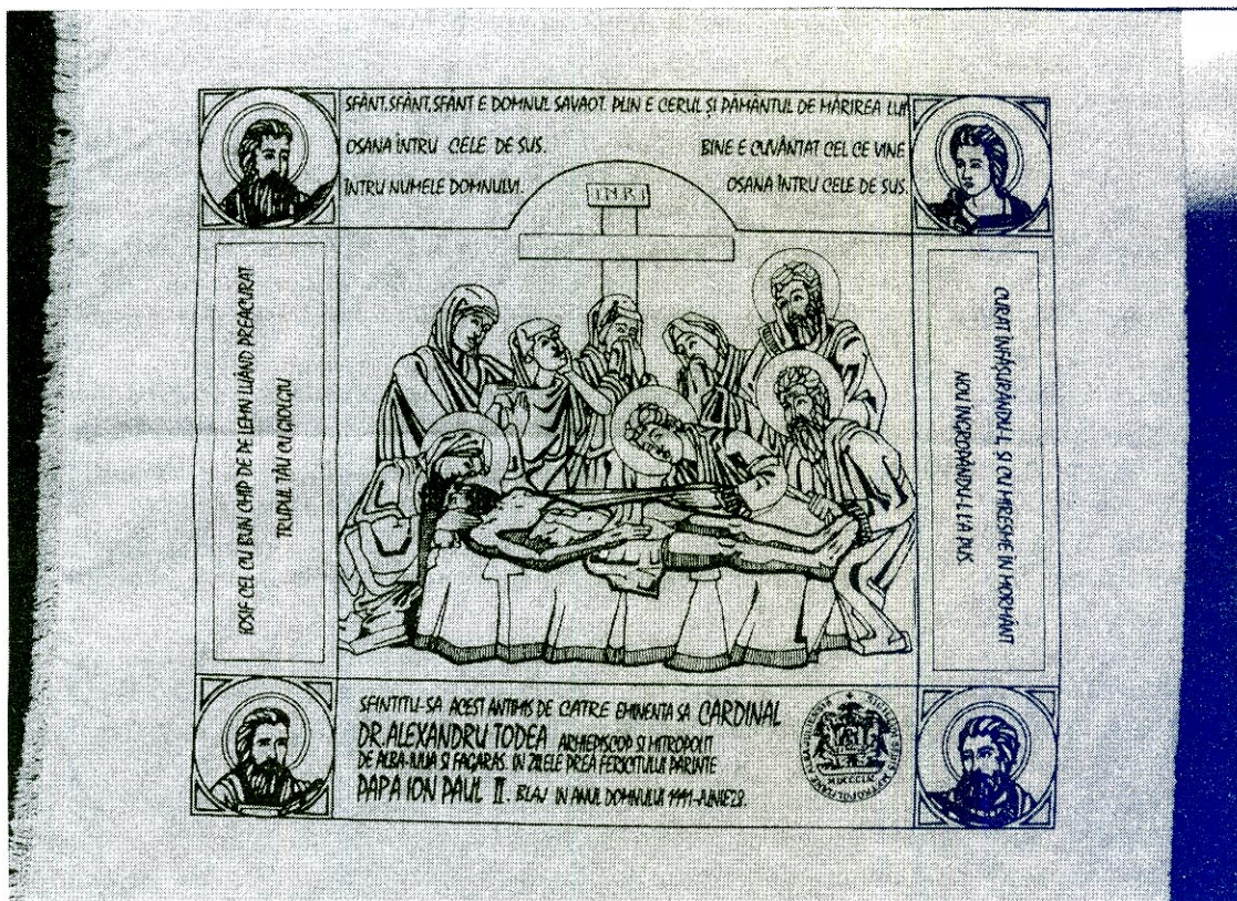
Fig. 3 Antimisul cardinalului Alexandru Todea, 1991