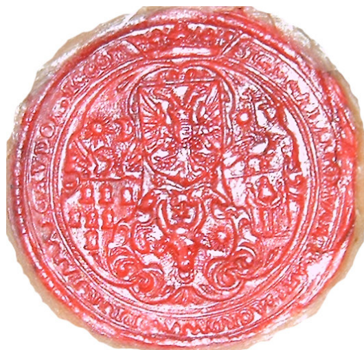
Fig. 5. Sigiliul lui Sigismund Báthori, 3 septembrie 1598 29 .