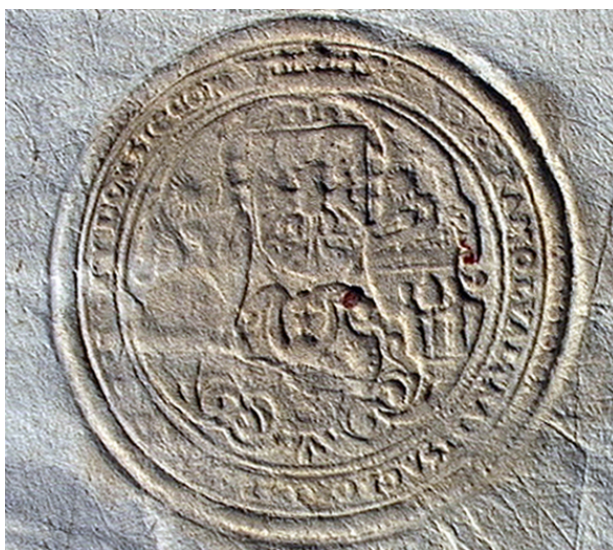
Fig. 1. Sigiliul lui Sigismund Báthori, 31 mai 1595.

principality itself (the medal from 1580) and that the seal from 1595 does not come as a consequence of the two treaties, signed on 20 May and 3 June, respectively, but rather reflects the early ideology in favour with the Court of Alba Iulia, an ideology of which the two treaties are a consequence. It remains, nevertheless, true that Transylvania's coat of arms was made with the help of the heraldic traditions of neighbouring countries, such as Poland and the Habsburgic Empire. A significant influence came from the coins issued under John Sigismund's authority and under that of his mother, queen Isabella, by Stephen Báthori, in his capacity as king of Poland, and by Ferdinand I. The opinion I support here is that the most important factor in the choice of a coat of arms for Transylvania was the relationship between Poland and the Báthori family, although the other influences cannot be neglected.