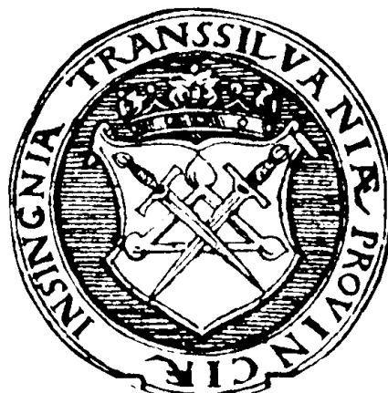
Fig. 7. Stema Transilvaniei în versiunea lui Georg Reichstorffer, 1550; apud Dan Cernovodeanu, Știința și arta heraldică în România , planșa XLIV, nr. 1.