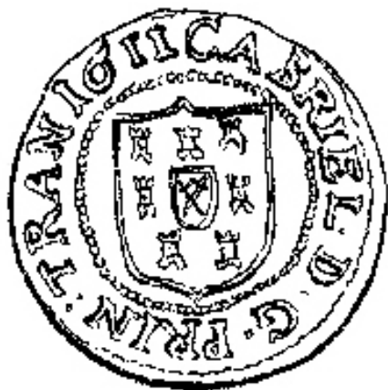
Fig. 10. Monedă emisă de principele Transilvaniei, Gabriel Báthori, la 1610; revers, apud Adolf Resch, Siebenbürgische Münzen und Medaillen von 1538 bis zur Gegenwart , planșa 20, nr. 151.