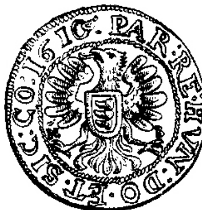
Fig. 9. Monedă emisă de principele Transilvaniei, Gabriel Báthori, la 1610; apud Adolf Resch, Siebenbürgische Münzen und Medaillen von 1538 bis zur Gegenwart , planșa 19, nr. 71.