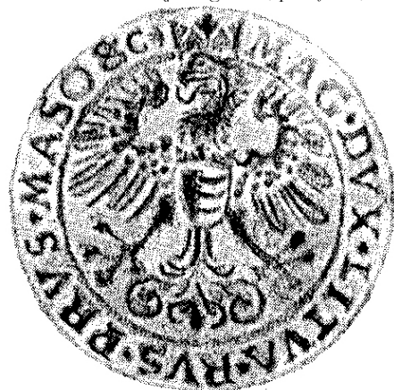
Fig. 8. Monedă emisă de regele Poloniei, Ștefan Báthori, la 1580; revers.