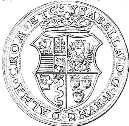
Fig. 14. Monedă emisă de Ioan Sigismund și regina Isabella, 1557; avers?, apud Adolf Resch, Siebenbürgische Münzen und Medaillen von 1538 bis zur Gegenwart , pl. 2, secțiunea III, nr. 26.