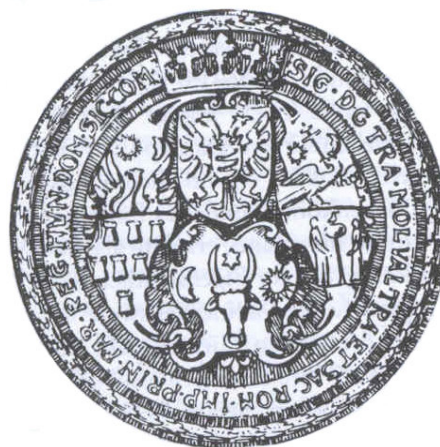
Fig. 3. Sigiliul lui Sigismund Báthori, 1592, apud Albert Arz von Straussenburg, Beiträge zur siebenbürgischen Wappenkunde , p. 14.