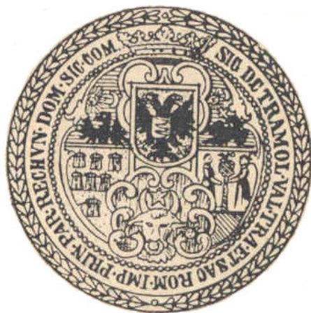
Fig. 2. Sigiliul lui Sigismund Báthori, 1595, apud J. Siebmacher's Grosses und allgemeines Wappenbuch , planșa e004.