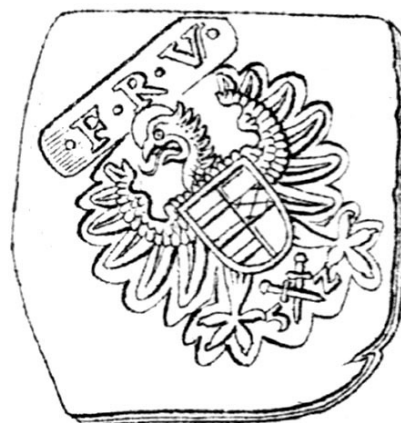
Fig. 13. Monedă emisă de Ferdinand I, 1552, apud Adolf Resch, Siebenbürgische Münzen und Medaillen von 1538 bis zur Gegenwart , pl. 2, nr. 14.