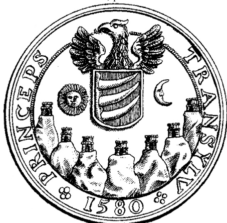
Fig. 6. Medalie dedicată lui Christophor Báthori, 1580, apud Adolpf Resch, Siebenbürgische Münzen und Medaillen von 1538 bis zur Gegenwart , planșa 62, nr. 15.