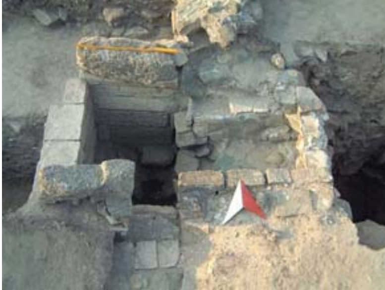
Fig. 3. Cripta din basilica „Florescu”