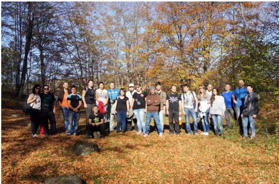
Fig. 3. Excursie la cetatea dacică de la Costești-Cetățuie.