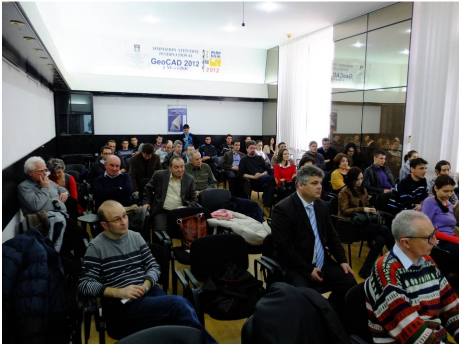
Fig. 2. Lansarea volumului Două decenii de arheologie studentească la Alba Iulia .