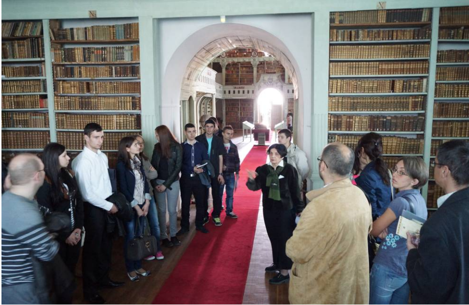
La Biblioteca Batthyaneum, în 18 aprilie, de Ziua internațională a monumentelor și siturilor arheologice.