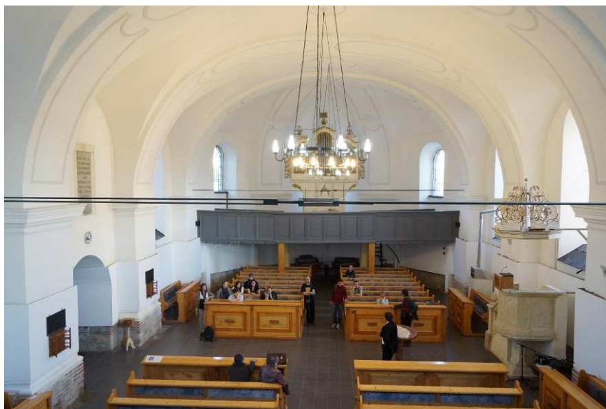
În 11 octombrie, la biserica reformată din Alba Iulia.