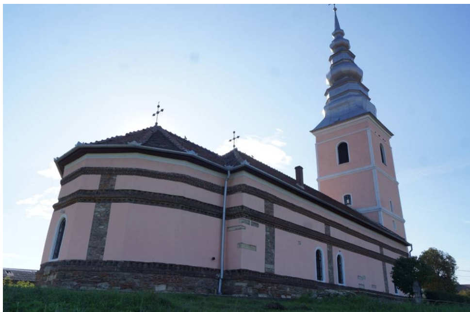
Biserica „Sfânta Treime” din cartierul Maieri II, Alba Iulia.