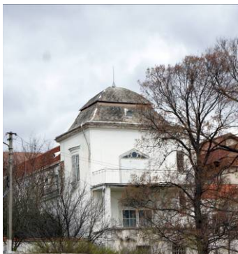
Castelul din Galda de Jos.