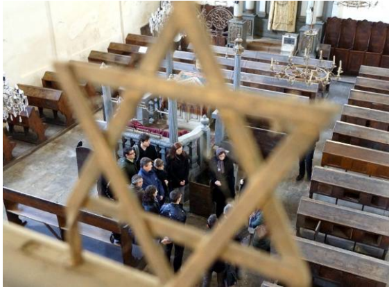
Sinagoga din Alba Iulia, exterior și interior (19 aprilie).