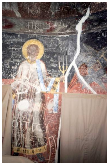
Biserica veche din Galda de Jos – detalii cu pictura absidei (secolul al XVIII-lea).