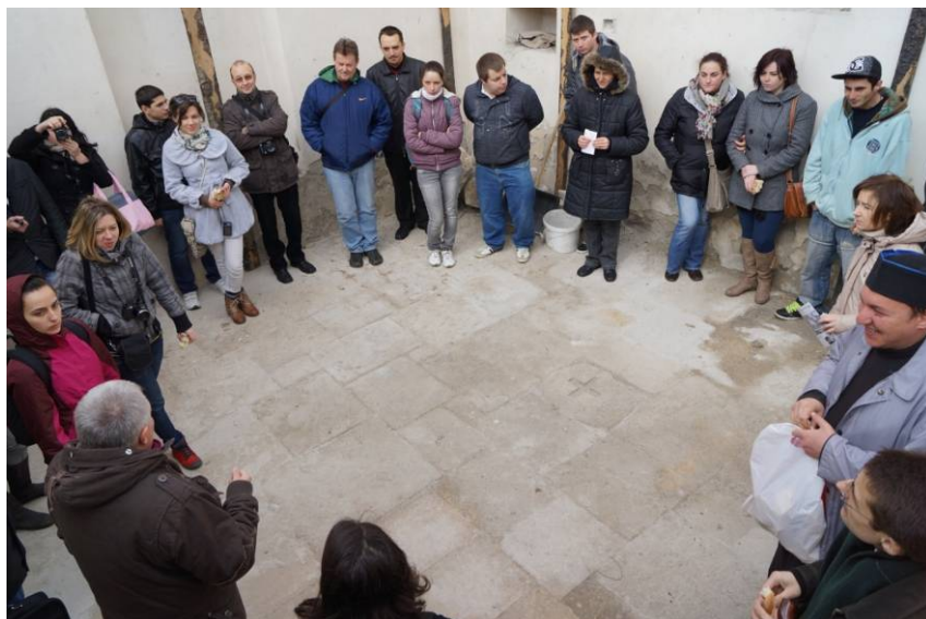
La Galda de Jos – discuții în pronaosul bisericii vechi.