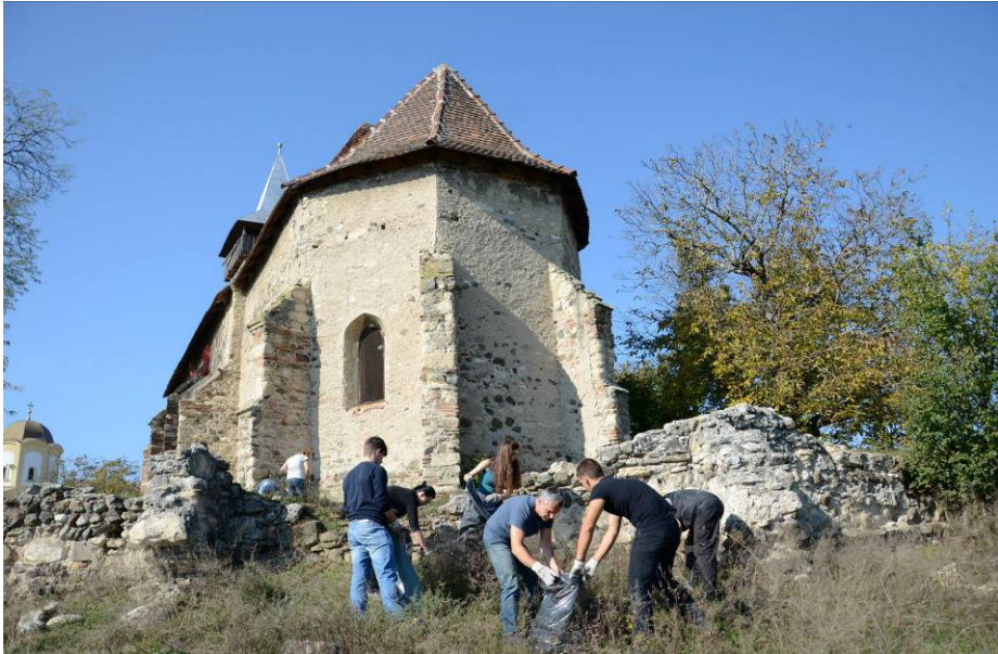
La biserica medievală din Sântimbru, în 12 octombrie.