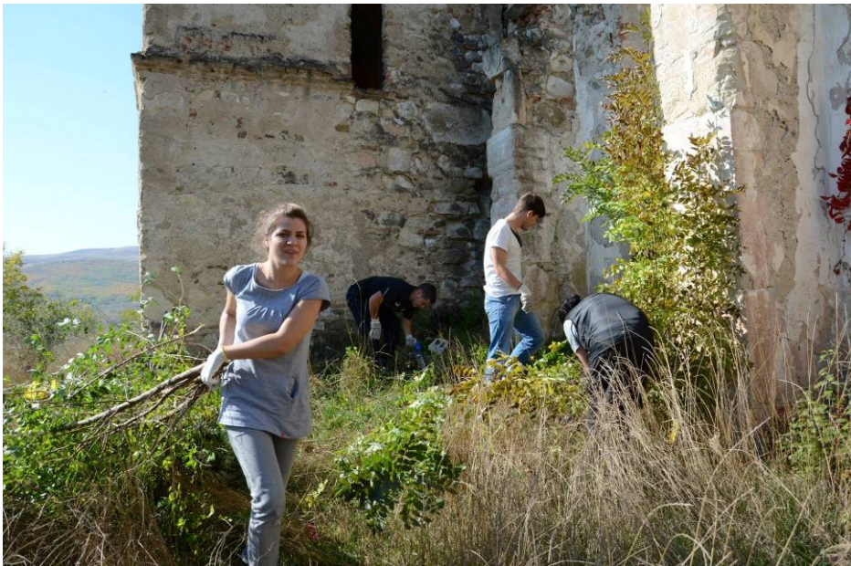
La ruina bisericii medievale din Benic, în 12 octombrie.