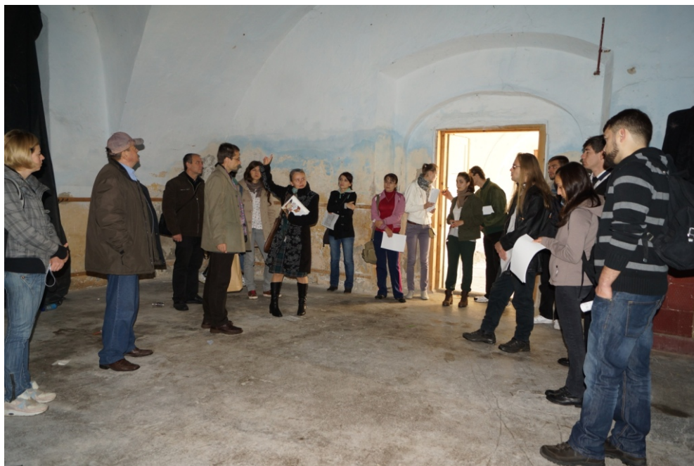
19 octombrie – în Palatul princiar din Alba Iulia.