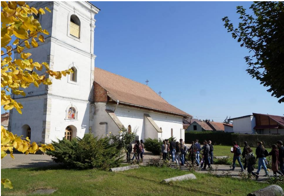
În 11 octombrie, la biserica din cartierul Lipoveni, Alba Iulia.