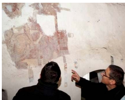
Galda de Jos – biserica veche: pictura medievală acoperită încă de tencuiei și zugrăveli.