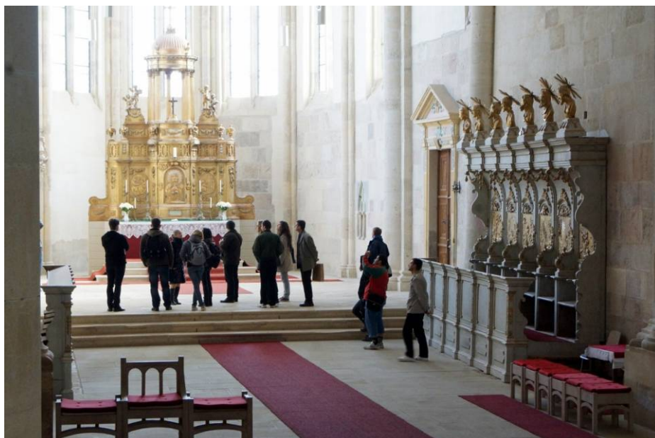
În sanctuarul catedralei romano-catolice din Alba Iulia (19 octombrie).