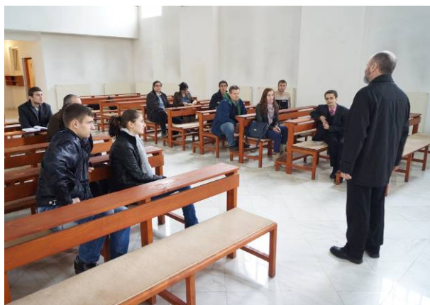
La biserica luterană din Alba Iulia, în 2 aprilie.