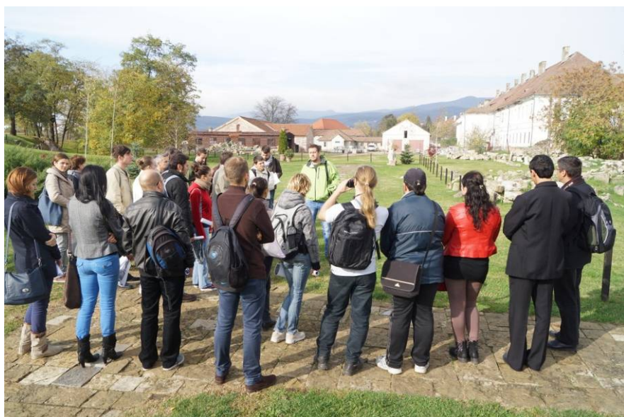
În 18 octombrie, despre succesiunea fortificațiilor la Alba Iulia.