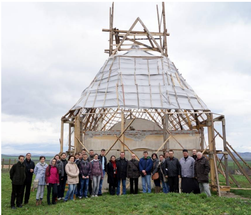
În 6 aprilie, la Galda de Jos, în fața monumentului aflat în restaurare.