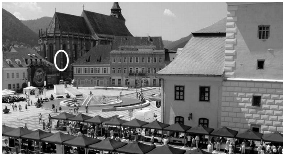
Fig. 5. Piața și Casa Sfatului din Brașov cu vedere spre Biserica Neagră și localizarea statuii Fecioarei Maria.