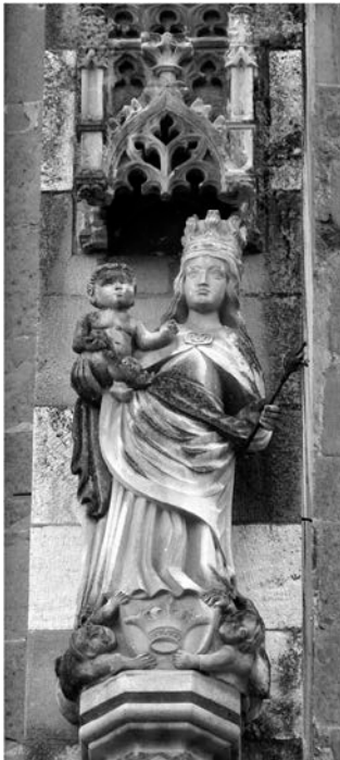
Fig. 2. Fecioara Maria pe un contrafort al Bisericii Negre (1430-1440).