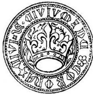
Fig. 3. Sigiliul orașului Brașov folosit înainte de 1378 cu textul S(igillum) CIVITATIS DE CORONA CIVITATE (Roth, Kronstadt in Siebenbürgen , p. 55).