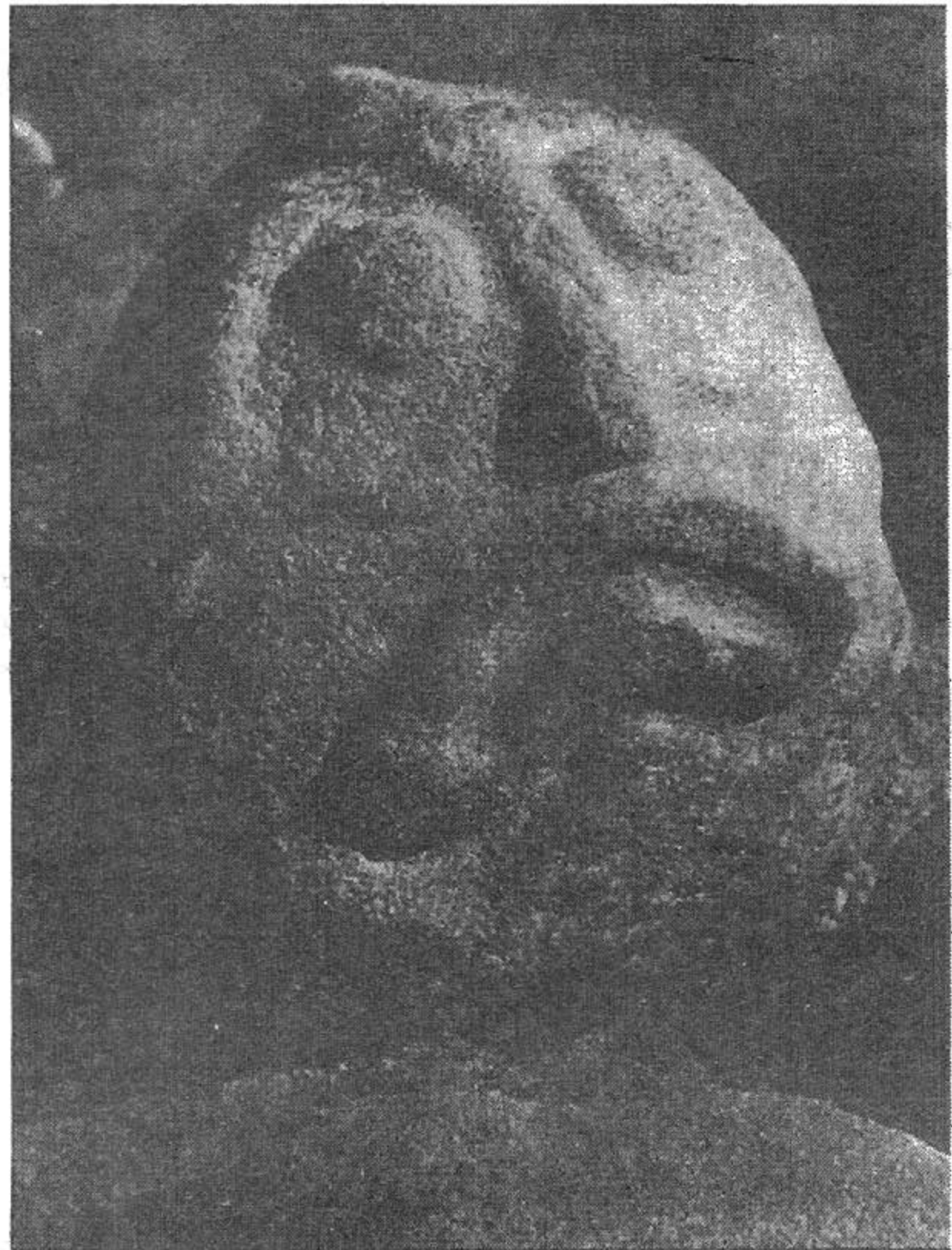
Fig. 2 Cap de piatră de la Lepenski Vir (după VLASSA 1972)

Eliade considera că, odată fixat în piatră, sufletul este silit să acționeze doar în sens pozitiv (ELIADE 1992, 402), dar părăsirea locuinței sub podeaua căreia erau înhumați defuncții, infirmă această ipoteză. Mai degrabă captarea sufletelor de către capetele de piatră se făcea pentru asigurarea liniștii celui decedat (JAMES 1959, 13) sau pentru dăinuirea în timp, ținând cont de durabilitatea pietrei (vezi construcțiile megalitice de mai târziu).