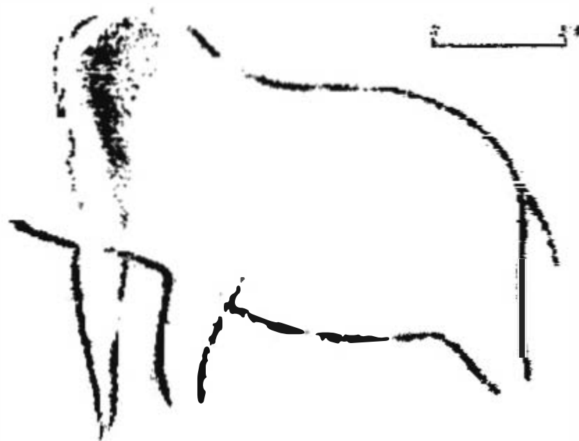
Fig. 3 - Figură parietală reprezentând un mamut din peștera Ignatievskaja