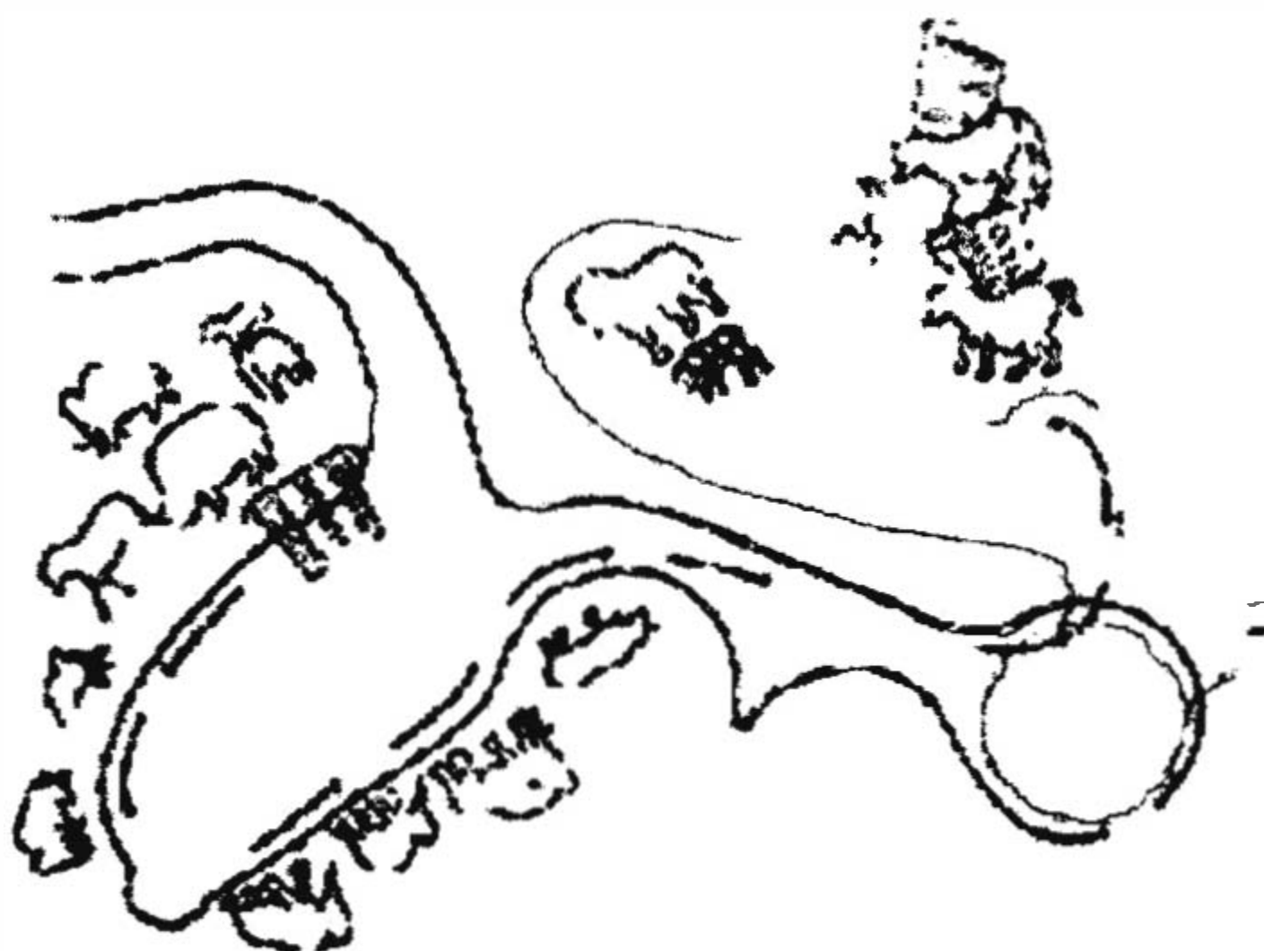
Fig. 4 - Ansamblul parietal din peștera Kapova

În al doilea rând, observăm că o parte importantă a animalelor din Est nu au conturul reliefat cu o altă nuanță și sunt realizate folosindu-se o unică culoare, prin umplerea totală a interiorului corpului, procedeu destul de rar întâlnit în arta vestică.