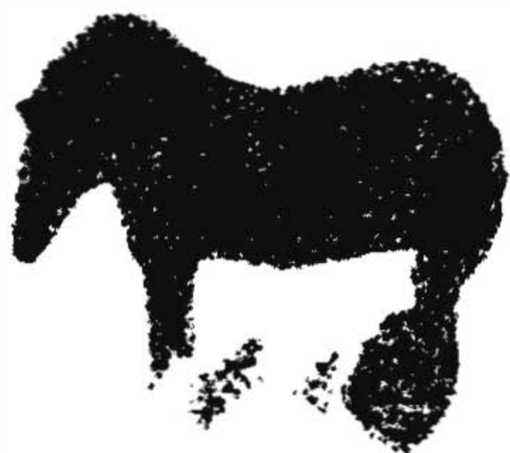
Fig. 1 - Căluțul din peștera Cuciulat