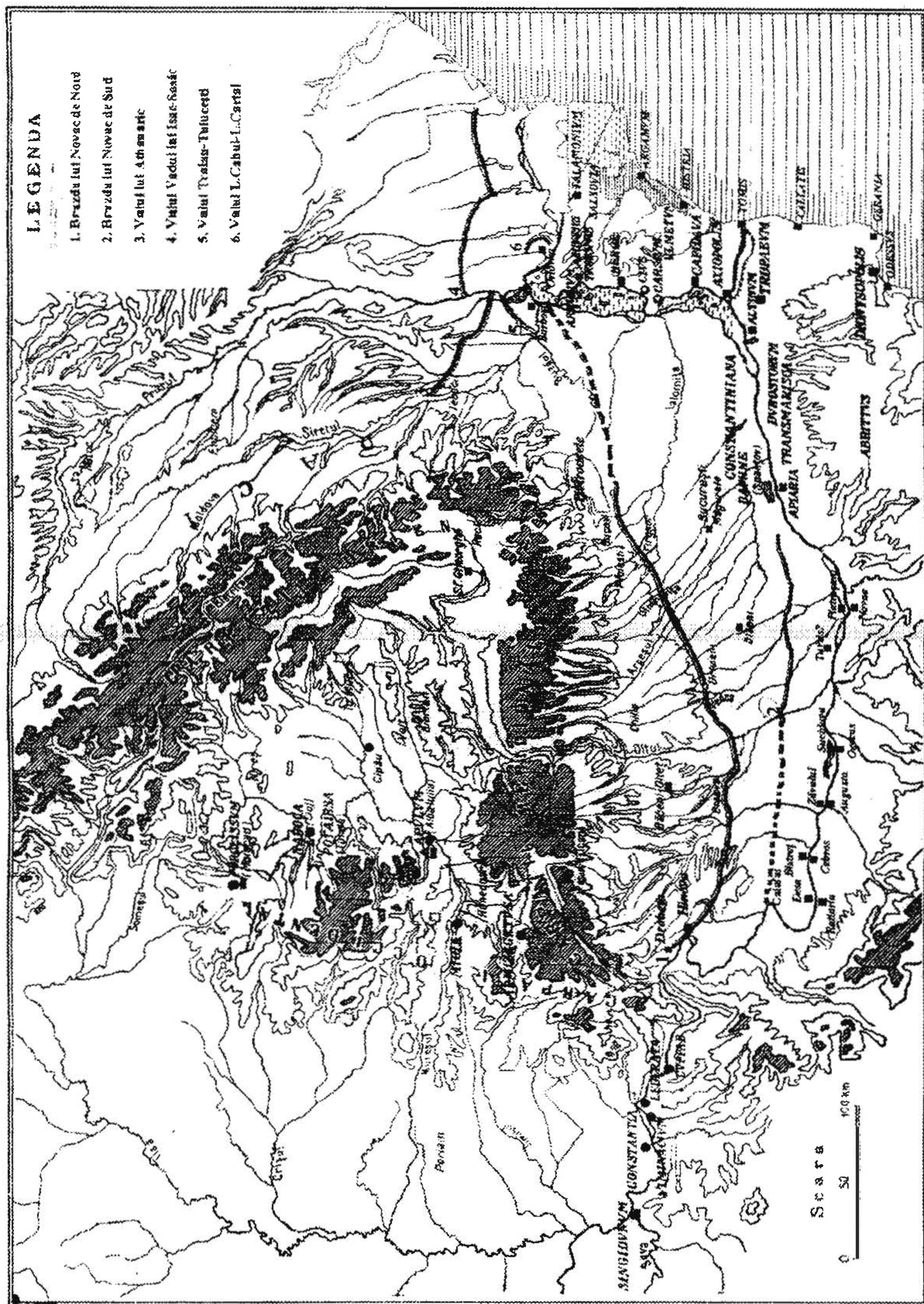
Fig. 1. Valurile din Câmpia Română și din sudul Moldovei

Am optat pentru studiul valurilor de pământ, în primul rând pentru că, după aprecierile noastre, ele pot releva aspecte importante ale vieții militare, politice și culturale din spațiul Daciei romane, asupra cărora nu dispunem de studii exhaustive care să le reflecte semnificația